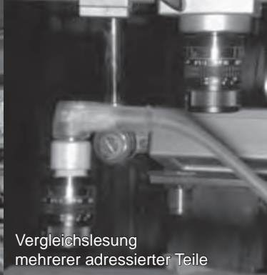
Vergleichslesung mehrerer adressierter Teile