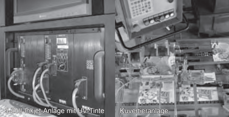
3-Zoll-Inkjet-Anlage mit UV-Tinte